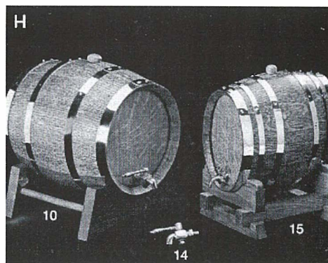
Slika 3. Bačvarska galanterija • Decorative cooperage