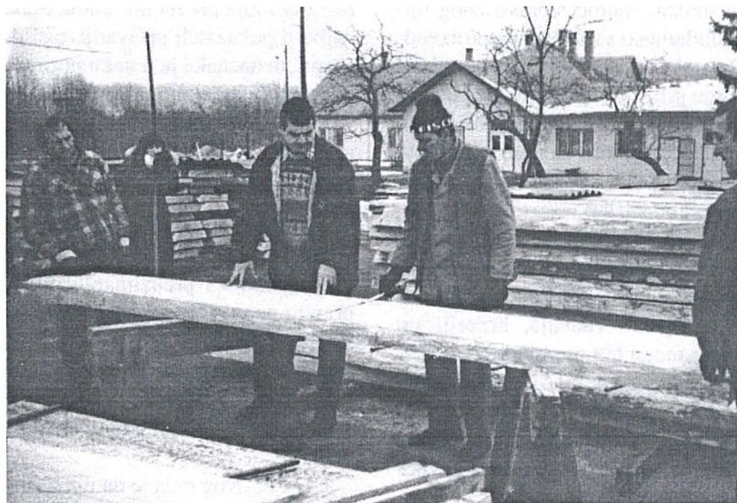
Slika 1. Preuzimanje hrastovih samica i polusamica • Handling of the unedged and half-edged oak boards

odgovornost povećanja odnosno smanjenja vrijednosti preuzete piljene građe (sl. 1).