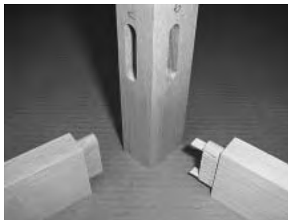
Slika 3. Kutni konstrukcijski oblik sastavljanja noge stolice s bočnom i stražnjom okvircicom pri čemu je bočna okvircica spojena zaobljenim čepom s umecima, a stražnja zaobljenim čepom i utorom Figure 3 Round-head mortise with bolts

Opisanom je konstrukcijom postignuta racionalizacija materijala smanjenjem poprečnog presjeka noge sa 45 x 45 mm na 26 x 26 mm. Također je dokazana tvrdnja da je moguće postići veću čvrstoću uz gotovo identičnu površinu lijepljenja (tabl. 1).