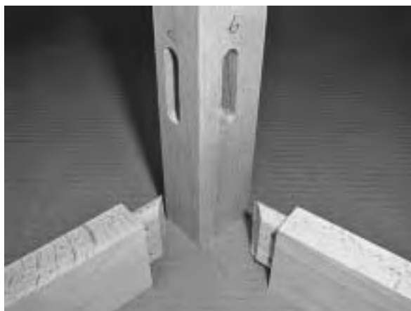
Slika 2. Kutni konstrukcijski oblik sastavljanja noge stolice s bočnom i stražnjom okvircicom sastavljene zaobljenim čepom sa skošenim sučeljem u podužno glodanim rupama Figure 2 Round-head mortise diagonally shortened in the tennons with lenthwise hole