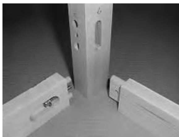
Slika 4. Kutni konstrukcijski oblik sastavljanja noge stolice s bočnom i stražnjom okvircicom od kojih je bočna okvircica spojena zaobljenim čepom, a stražnja okruglim čepovima, vijkom i T (unit) maticom Figure 4 Round-head mortise in combination with dowel, through-bolt and T unit

Statistički neodređene prostorne strukture konstrukcija namještaja reducirane su na tip položenih ok-